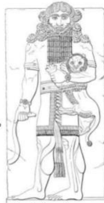
Ο Γκιλγαμές, σύγχρονο έργο. https://el.wikipedia.org/wiki/Σουμέριοι