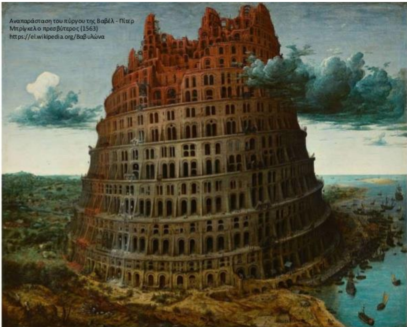
Αναπαράσταση του πύργου της Βαβέλ - Πίτερ Μπρίγκελ ο πρεσβύτερος (1563) https://el.wikipedia.org/Βαβυλώνα