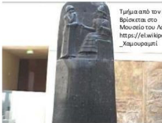
Τμήμα από τον Κώδικα του Χαμουραμπί. Βρίσκεται στο Μουσείο του Λούβρου, Παρίσι. https://el.wikipedia.org/wiki/Κώδικας_του_Χαμουραμπί