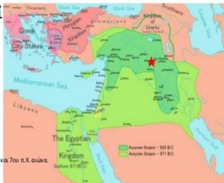
Χάρτης του Ασσυριακού κράτους μεταξύ 9ου και 7ου π.Χ. αιώνα. https://el.wikipedia.org/wiki/Ασσυρία