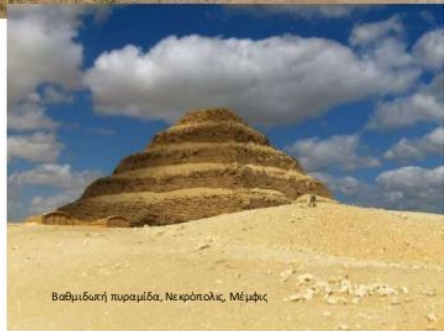
Βαθμιδωτή πυραμίδα, Νεκρόπολις, Μέμφις