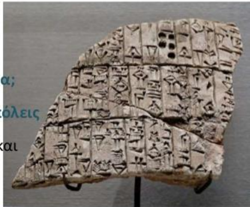
Σουμεριακό κείμενο. Η γραφή γινόταν πάνω σε πήλινες πινακίδες. https://el.wikipedia.org/wiki/Σουμέριοι#