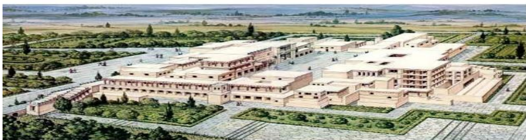
2. Αναπαράσταση του ανακτόρου της Κνωσού.

► Σύγκριση - διαφορές μινωικού ανακτόρου - μυκηναϊκού μεγάρου