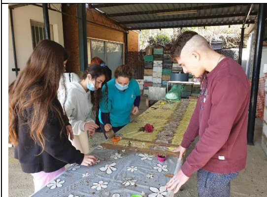
Κατασκευή κεριών από κερι μέλισσας