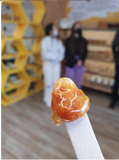
Δοκιμή μελιού με γύρη, μιας σπουδαίας υπερτροφής!