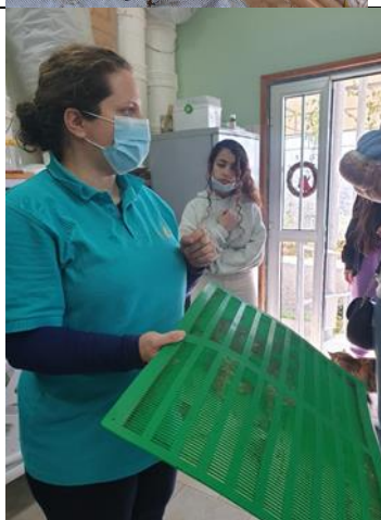
Τρόπος συλλογής πρόπολης

Κατά την περιήγησή μας στις πυρόπληκτες περιοχές προσπαθήσαμε να βρούμε μέλισσα και να παρατηρήσουμε τη συμπεριφορά των μελισσών σε ένα τόσο πλέον φτωχό από ανθοφορία οικοσύστημα. Τα μέλισσα ήταν ελάχιστα σε σχέση με προηγούμενως και σύμφωνα με πληροφορίες που πήραμε από τηλεφωνική συνέντευξη με τον κ. Κώστα Χειμώννα, ντόπιο μελισσοκόμο με μακρόχρονη εμπειρία, το 75% της μελισσοκομίας έχει καταστραφεί μετά τη μεγάλη πυρκαγιά. Οι επαγγελματίες μελισσοκόμοι, παρόλη την στήριξη της κυβέρνησης δυσκολεύονται να ξαναδημιουργηθούν από τις στάχτες που άφησε πίσω της η πυρκαγιά. Ενθαρρυντική είναι όμως η ίδρυση του Κέντρου «Μέλισσα Ζωή» στην πυρόπληκτη Οδού με πρωτοβουλία της Τράπεζας Κύπρου και των Ροταριανών Ομίλων Κύπρου και με στόχο την περιβαλλοντική αναζωογόνηση και την επαναφορά της οικονομικής και επαγγελματικής ανάκαμψης των πυρόπληκτων περιοχών παραγωγής μελιού.